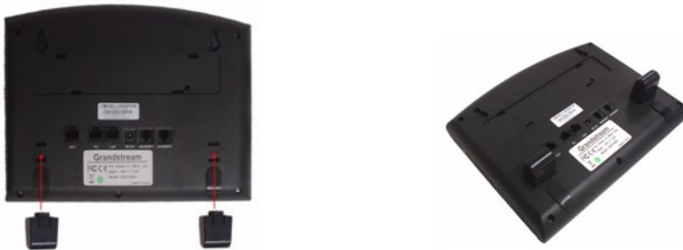
Figura 2: Conecte los espaciadores al GXP1200

Para colocar el teléfono en la pared, coloque dos ganchos fijos en la pared, cuelgue la parte trasera del teléfono en los ganchos.