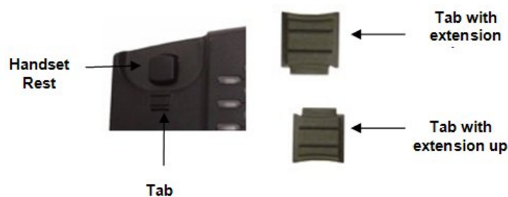
Figura 4: Colocando la pestaña para colgar el teléfono en la pared

Para usar el auricular, saque la pestaña (extensión hacia abajo) de la base del auricular, rote la pestaña e introdúzcala nuevamente en la ranura con la extensión hacia arriba para sostener el auricular.