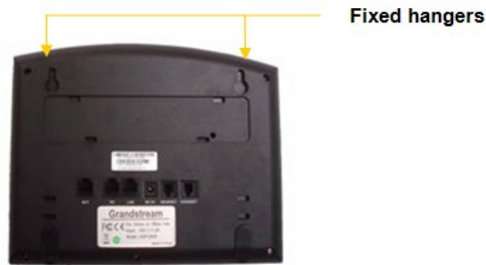
Figura 3: Localización de los colgadores en el GXP1200

Para usar el auricular, saque la pestaña (extensión hacia abajo) de la base del auricular, rote la pestaña e introdúzcala nuevamente en la ranura con la extensión hacia arriba para sostener el auricular.